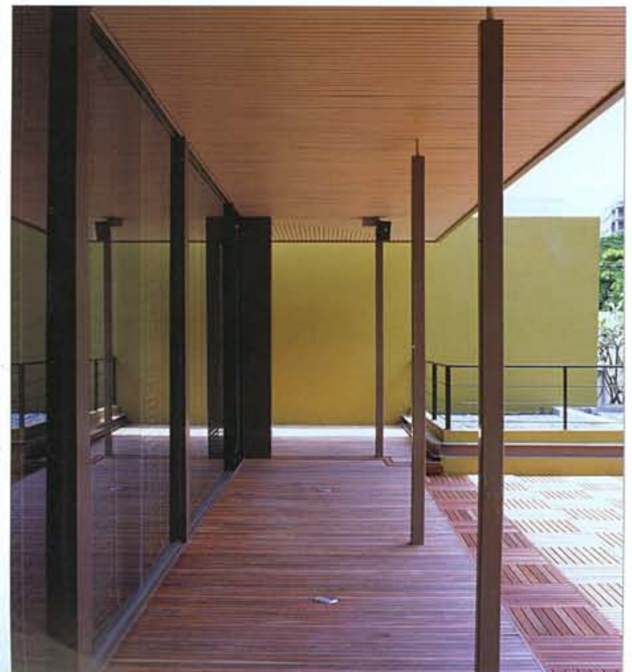
(บนซ้าย ขวา) สถาปนิกเลือกใช้โครงสร้างเหล็กที่มีเส้นสายเรียบง่ายและเห็นเพียงมิติคาร์ตในแกนต่อเติมตัวอาคาร (ซ้ายล่าง) มุมมองบนระเบียงชั้น 2 ใช้โครงสร้างเหล็กที่เบาเบา เพื่อรองรับเสาอาคารช่วงกว้าง (ขวา) พื้นที่บริเวณบาร์และเสิร์ฟ เป็นส่วนต่อเติมที่สร้างใหม่ทั้งหมดด้วยการใช้ความสูงแบบ double height และการเล่นระดับของพื้นที่เพื่อแบ่งพื้นที่ใช้สอย